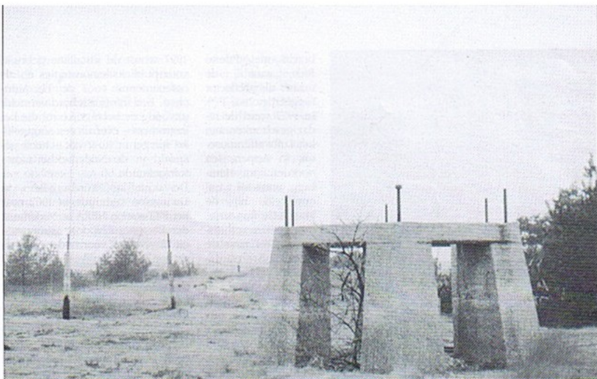
Het fundament van de verdwenen Würzburg-Reus in Radio Kootwijk. Deze opname werd gemaakt in maart 1963.

was in feite de grotere broer van kleinere Würzburg-parabolen met een geringer afstands bereik.