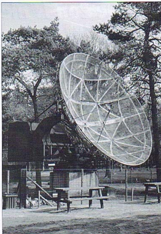
De Würzburg-Reus op het buitenterrein van het Nationaal Oorlogs- en Verzetsmuseum in Overloon. Deze installatie heeft in Radio Kootwijk misschien aan de wieg van de radiosterrenkunde in ons land gestaan. (Foto: George Beekman)

De Würzburg-Reus op het terrein van de Volkssterrenwacht Simon Stevin in Hoeven. Deze installatie heeft in Radio Kootwijk misschien aan de wieg van de radiosterrenkunde in ons land gestaan. (Foto: George Beekman)