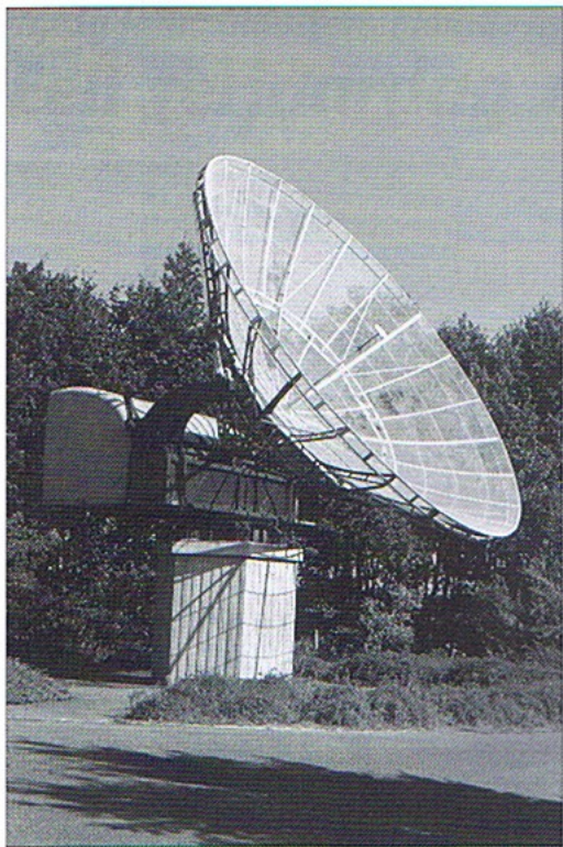
De Würzburg-Reus bij de ingang van het Planetron in Dwingeloo bestaat uit een in Radio Kootwijk gemaakte 10 meter reflector en een uit Noorwegen afkomstige opstelling.

lefoongesprekken, brieven en bezoeken echter niet tot het gewenste doel geleid. Het probleem is dat alle installaties meer dan eens van plaats zijn veranderd en dat niet al die verhuizingen zijn gedocumenteerd. Verder is ook niet duidelijk uit hoeveel stukjes de puzzel nu precies bestaat. En tot slot spreken 'getuigen' elkaar soms gewoon tegen.